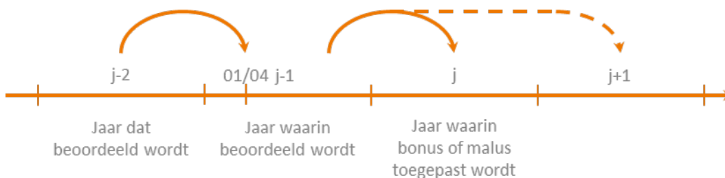
Figuur 2 Schematische tijdslijn van de beoordeling van de kwaliteitsindicatoren en de berekening van de financiële incentives